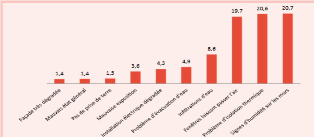
Figure 3.2 : Des dysfonctionnements persistants à l'intérieur des logements (en %)