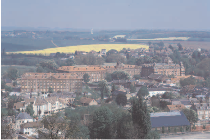
Vue du Familistère

rieur par dix passages, qui donnent également accès aux escaliers placés dans les angles. À chaque étage, une galerie. Ces galeries des trois bâtiments communiquent entre elles, à chaque étage, par des corridors. Les escaliers sont larges de façon à permettre de se croiser aisément.