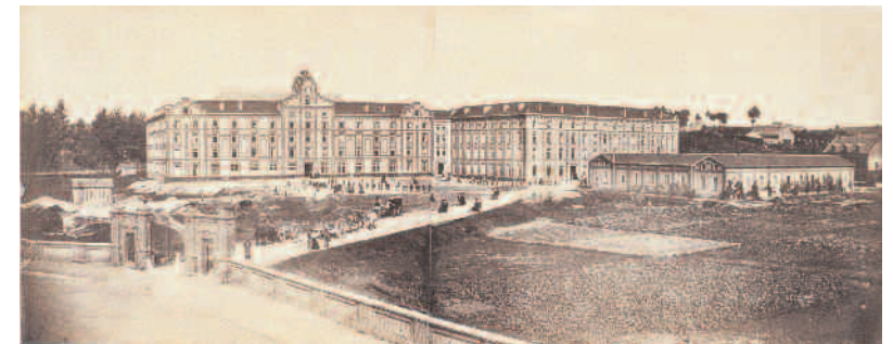
Vue du Familistère à l'achèvement du pavillon central du Palais Social en 1865

Le palais a une façade de 180 m et son périmètre développé est de 450 m. Chaque bâtiment a entre 65 m (le central) et 50 m (l'aile gauche) de façade. Les bâtiments sont reliés entre eux et avec l'exté-