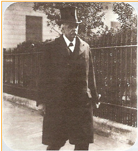
Lord Arthur Balfour