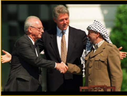
Yitzhak Rabin, Bill Clinton et Yasser Arafat durant la signature des accords d'Oslo, le 13 septembre 1993.

Les Accords d'Oslo représentent l'ensemble des accords conclus entre Israël et les Palestiniens. Ils ont fixé le calendrier et les règles de la mise en place progressive de l'autonomie en Cisjordanie et à Gaza ainsi que les conditions des négociations finales sur les questions restées en suspens.